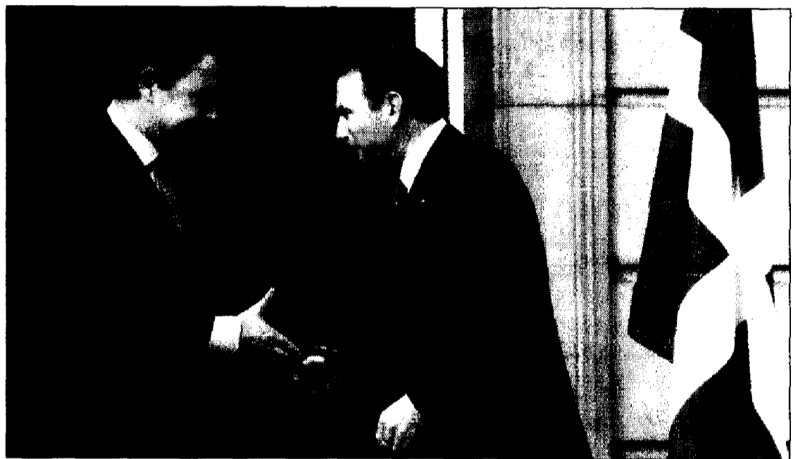
Le chef du gouvernement espagnol, José Luis Zapatero (à gauche), a rencontré jeudi à Madrid Juan José Ibarretxe pour le dissuader de mener à bien son projet de faire du Pays basque une « nation librement associée à l'Etat espagnol ».

Alors que José Luis Zapatero a rencontré jeudi à Madrid Juan José Ibarretxe pour le dissuader de mener à bien son projet, il a